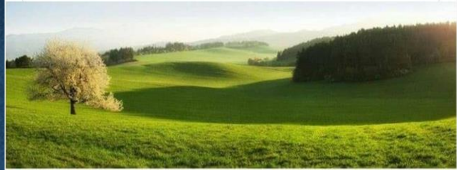
Same Tree, Four Seasons Cherry tree in Žabokreky, Slovakia